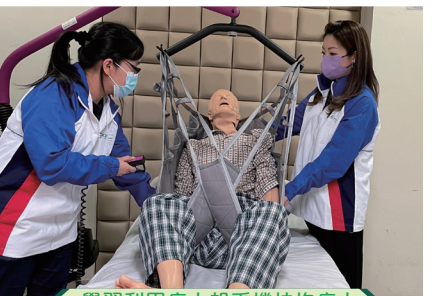
學習利用病人起重機扶抱病人

健康護理實務（高中應用學習）課程已獲香港資歷架構認可資歷級別：3 資歷名冊登記號碼：18/000858/L3 登記有效期：01/01/2019 to 31/12/2026