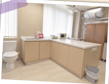
模擬家居廚房及浴室