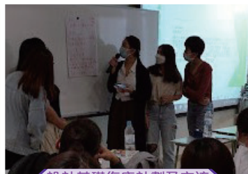
設計基礎復康計劃及交流