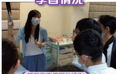
認識復康儀器的操作