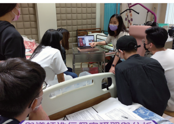
與導師進行個案研習與分析